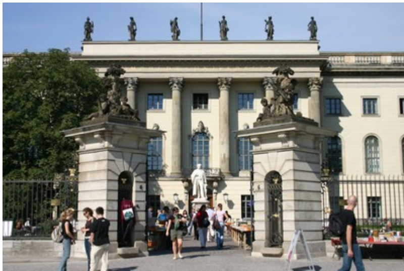
Hauptgebäude der Humboldt-Universität zu Berlin

Auf der nächsten Seite finden Sie wichtige Informationen, die Ihnen den Einstieg an der Universität erleichtern sollen.